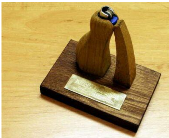
Křesadlo 2001 – 2002

Za rok 2002 to bylo celkem 31 křesadel, které kromě Prahy předávali naši partneři v šesti městech – Česká Lípa, České Budějovice, Pelhřimov, Olomouc, Ústí nad Labem a Zlín.